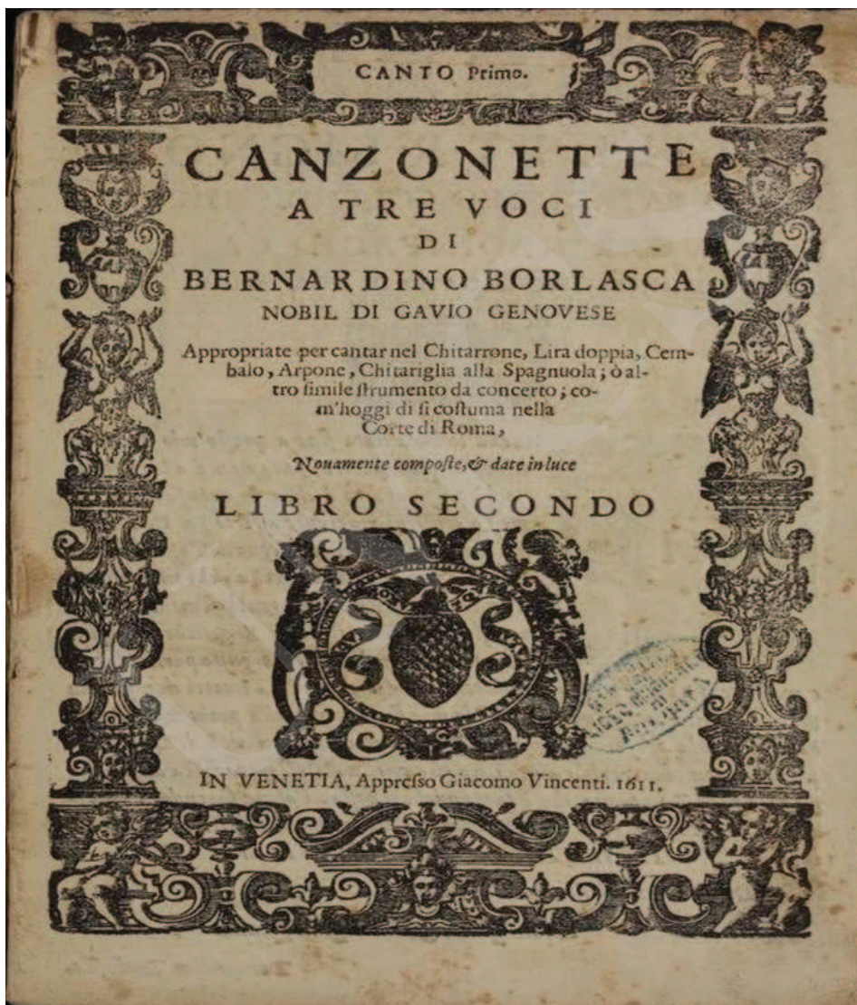
Ilustracja 4. Bernardino Borlasca, Canzonette , I-Bc, sygn. X. 140.