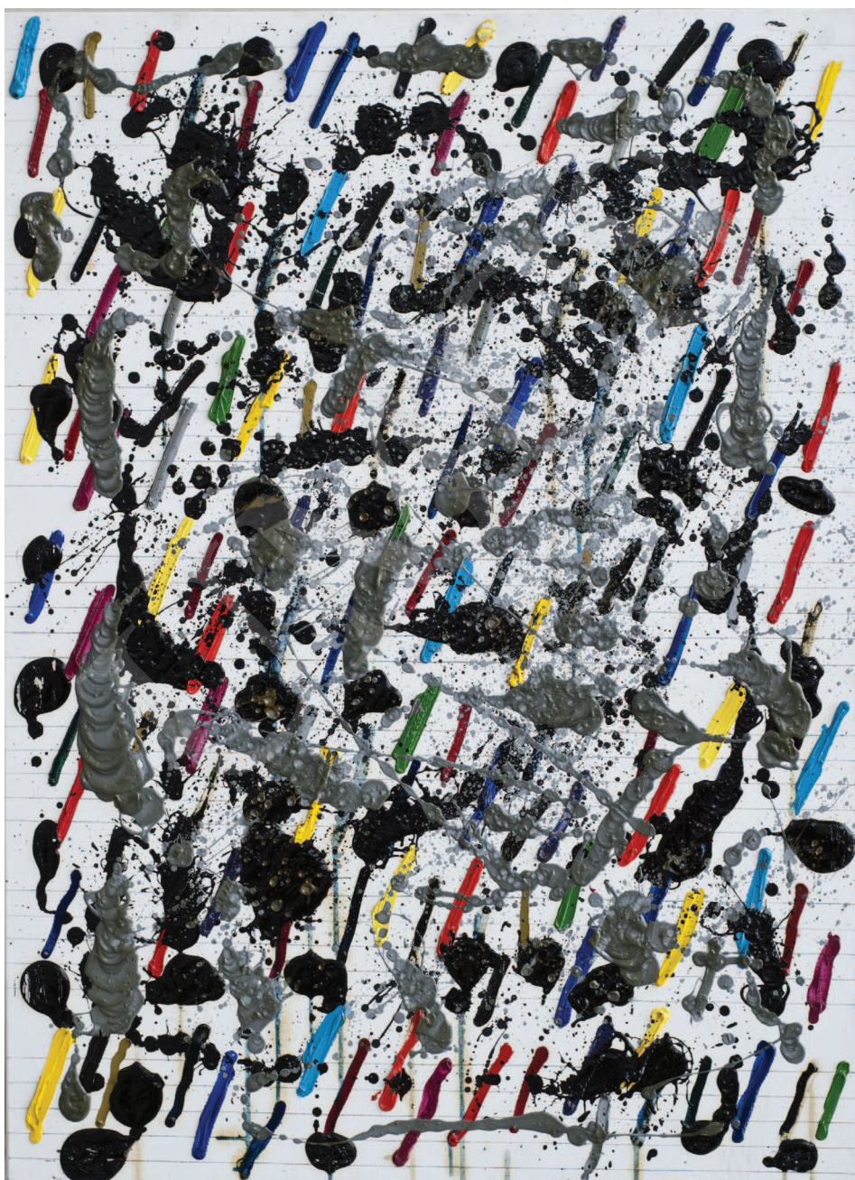
Ilustracja 1. W. Pawlak, Partytura do baletu Sokrates III , 2003, 73x100 cm, fot. K. Kuzko