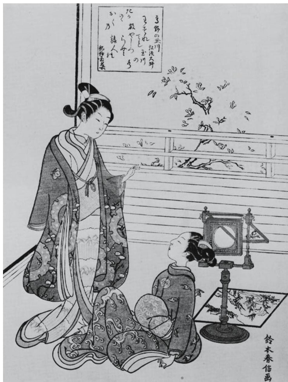
Ilustracja 11. Suzuki Harunobu (1725?-1770), Dwie piękne dziewczyny z zogrscope , drzeworyt koniec lat 1760(?).