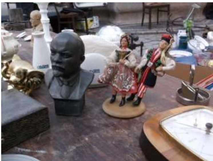
Fot. 9. Lenin i Krakowiacy

Nasze znaczki jak i inne przedmioty swoją obecnością wikłają Rynek dzisiejszej Giełdy w niezliczoną ilość własnych powiązań przyczyn i skutków, znaczeń i wartości z równie niezliczoną ilością innych miejsc i czasów mniej lub bardziej odległych. Zgromadzone na Rynku przedmioty stanowią także rozmaite relacje między sobą. Przybysze ze Wschodu rozglądają się po Rynku wśród innych ceramicznych figurek (Fot. 5), Budda odpoczywa wśród Madonn (Fot. 6), a Lenin spotyka się z Krakowiakami (Fot. 9).