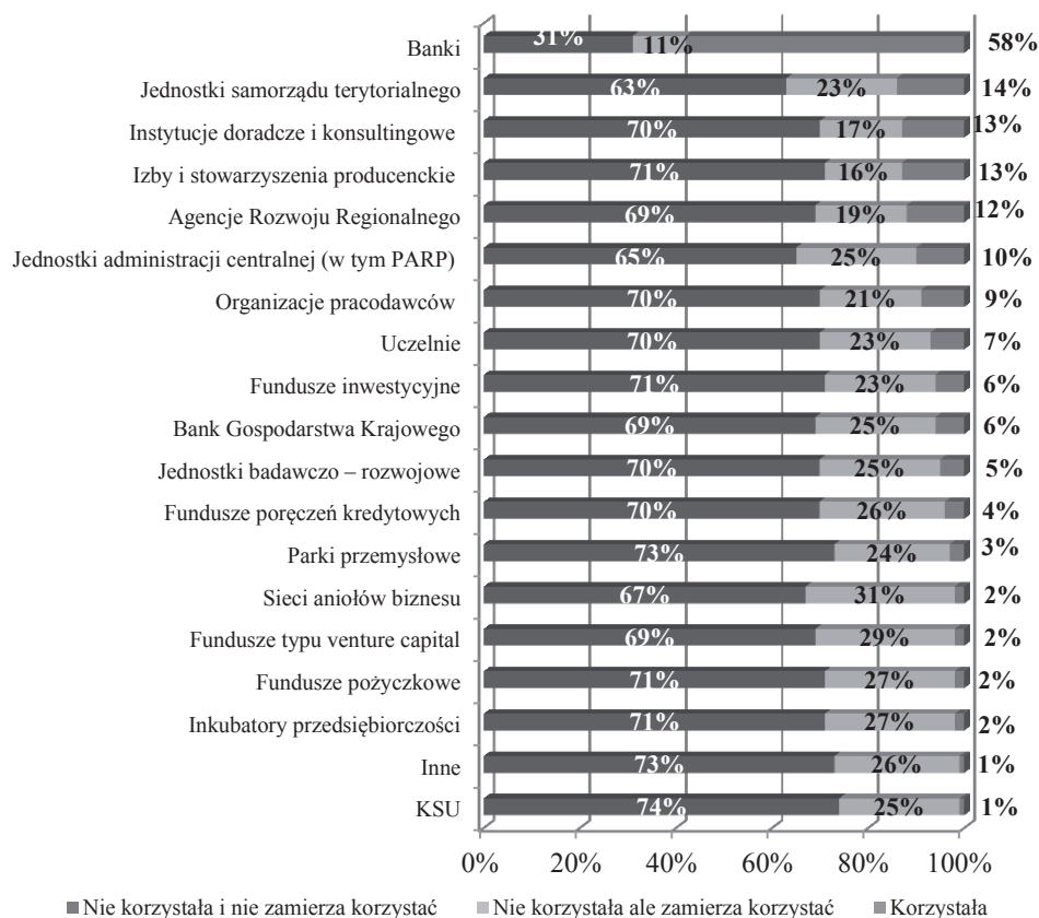
Rysunek 1. Rzeczywiste wsparcie przedsiębiorstw realizujących projekty innowacyjne uzyskane w poszczególnych instytucjach otoczenia biznesu