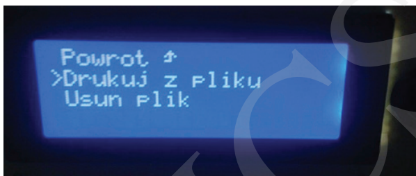
Fot. 4. Wybór akcji pliku, fot. Adrian Kędzierski.

Zalecana wysokość temperatury to 220°C. Gdy już upewnimy się, że wszystkie wyżej wymienione czynności zostały wykonane, z wyświetlanego menu za pomocą pokrętki wybieramy nazwę projektu i zatwierdzamy wciśnięciem pokrętki.