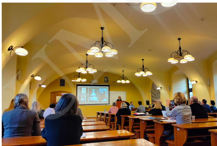
Fot. 3. Prezentacja jednego z wystąpień.

zostaje na jej terenie wiele materiałów wyborczych. Prelegent wskazał, że w bieżącym roku zebrano 3 miliony kilogramów samych banerów, wykonanych z plansz PVC. Liczba ta zapełniła ponad 300 śmieciarek. Stanowi to realne zagrożenie dla środowiska. Powstaje więc pytanie, co zrobić z taką ilością odpadów. Mniejszym problemem są materiały wyborcze papierowe, które można poddać recyklingowi. Plansze PVC zawierające chlor mogą zostać powtórnie wykorzystane np. do docieplania budynków, ponieważ dobrze izolują i chronią przed deszczem. Sprawdzają się również jako zabezpieczenie przedmiotów przechowywanych na zewnątrz. Ostatnio są również wykorzystywane do tworzenia ekozdób lub przedmiotów artystycznych. Wystąpienie to zamknęło pierwszą sesję.