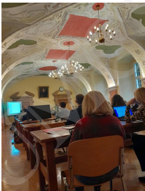
Fot. 9. Prezentacja jednego z wystąpień.

króla, „wziąć pod rękę Marsa, by wspomagać go w lepszych czasach”. Tło polityczne stanowił powrót Króla Zygmunta III Wazy z podróży do Szwecji, a wątki poruszane w poemacie są odwołaniem do złych nastrojów i bezprawia, jakie opanowały Starą Warszawę i Nowe Miasto.