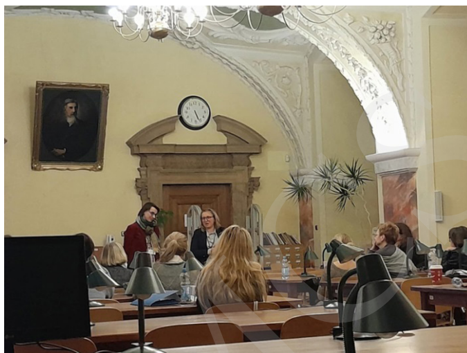
Fot. 11. Prezentacja jednego z wystąpień.