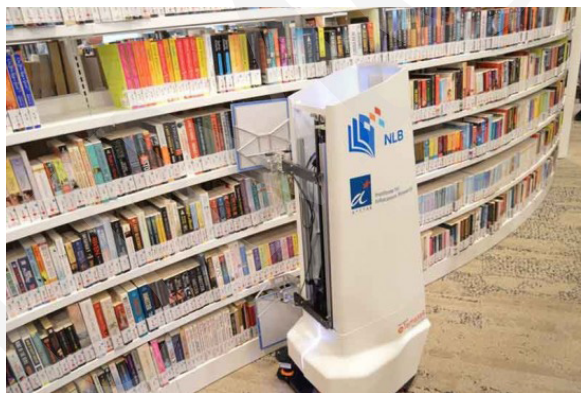
Fot. 14. Robot AuRoSS.

Rozwój technologii ma za zadanie ułatwienie pracy. Do czasochłonnych prac wykonywanych w bibliotece, takich jak inwentaryzacja czy weryfikacja tego, czy książka znajduje się we właściwym miejscu na regale, wykorzystuje się roboty magazynowe. Przykładem takiego robota jest wynaleziony przez singapurskich naukowców AuRoSS ( Autonomous Robotic Shelf Scanning System ). Robot ten samodzielnie przemieszcza się między regałami bibliotecznymi i wykorzystując technologię RFID, skanuje książki, następnie generuje raport o brakujących lub źle odłożonych pozycjach. Według badań robot ten osiągnął poziom dokładności wynoszący 99% 28 .