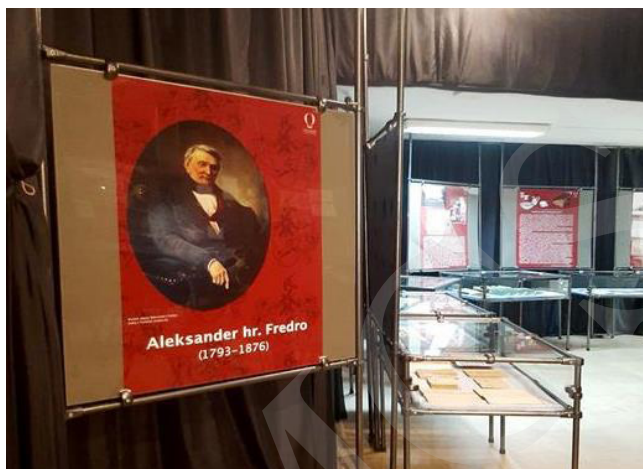
Fot. 6. Wystawa Aleksander hr. Fredro – polski Molière. W 230. rocznicę urodzin.