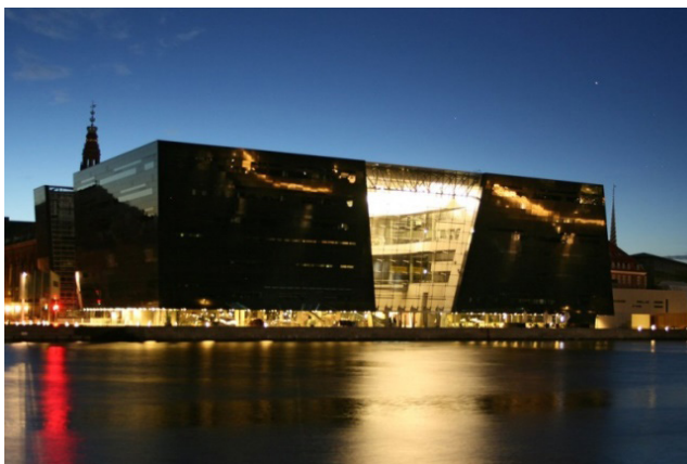
Fot. 7. Biblioteka Królewska w Kopenhadze.

W XXI w. nowo wybudowane budynki biblioteczne stały się przykładami nowoczesności, łącząc tradycyjne funkcje z innowacyjnymi rozwiązaniami technologicznymi i architektonicznymi. Jedną z najnowocześniejszych bibliotek w Europie jest Biblioteka Królewska w Kopenhadze powszechnie nazywana „Czarny Diament” ze względu na charakterystyczną elewację z czarnego granitu. Budynek znajduje się