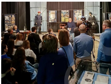
Fot. 3. Wernisaż wystawy „Szembekowie i Fredrowie w Dziejach Polski”.