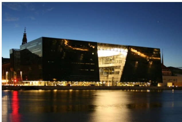
Fot. 7. Biblioteka Królewska w Kopenhadze.

W XXI w. nowo wybudowane budynki biblioteczne stały się przykładami nowoczesności, łącząc tradycyjne funkcje z innowacyjnymi rozwiązaniami technologicznymi i architektonicznymi. Jedną z najnowocześniejszych bibliotek w Europie jest Biblioteka Królewska w Kopenhadze powszechnie nazywana „Czarny Diament” ze względu na charakterystyczną elewację z czarnego granitu. Budynek znajduje się