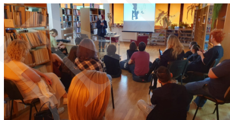
Fot. 4. Spotkania z mangą i anime.