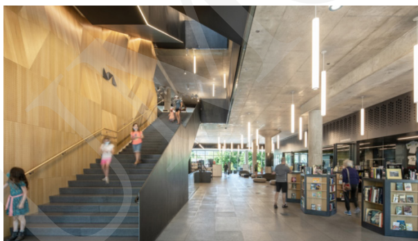
Fot. 8. Missoula Public Library.

Kolejną biblioteką stworzoną z myślą o przyszłych czytelnikach jest amerykańska biblioteka publiczna Missoula, która w 2022 r. otrzymała nagrodę dla najlepszej biblioteki (Public Library of the Year Award) przyznawaną przez Międzynarodową