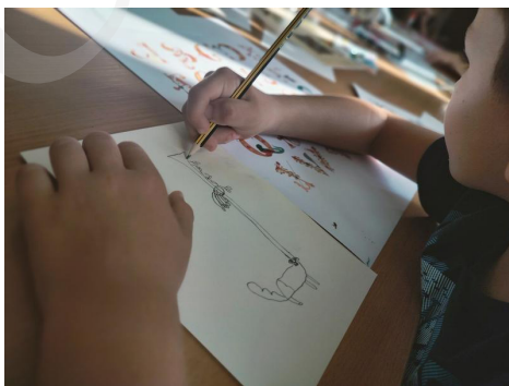
Fot. 6 . Projektowanie inicjału, fot. A. Mikulska.

Bogactwo fantazyjnych inicjałów oraz wibrujących kolorem wielobarwnych bordiur zainspirowało do działań twórczych uczestników warsztatów kreatywnych, przygotowanych w Oddziale Zbiorów Specjalnych dla zorganizowanych grup szkolnych.