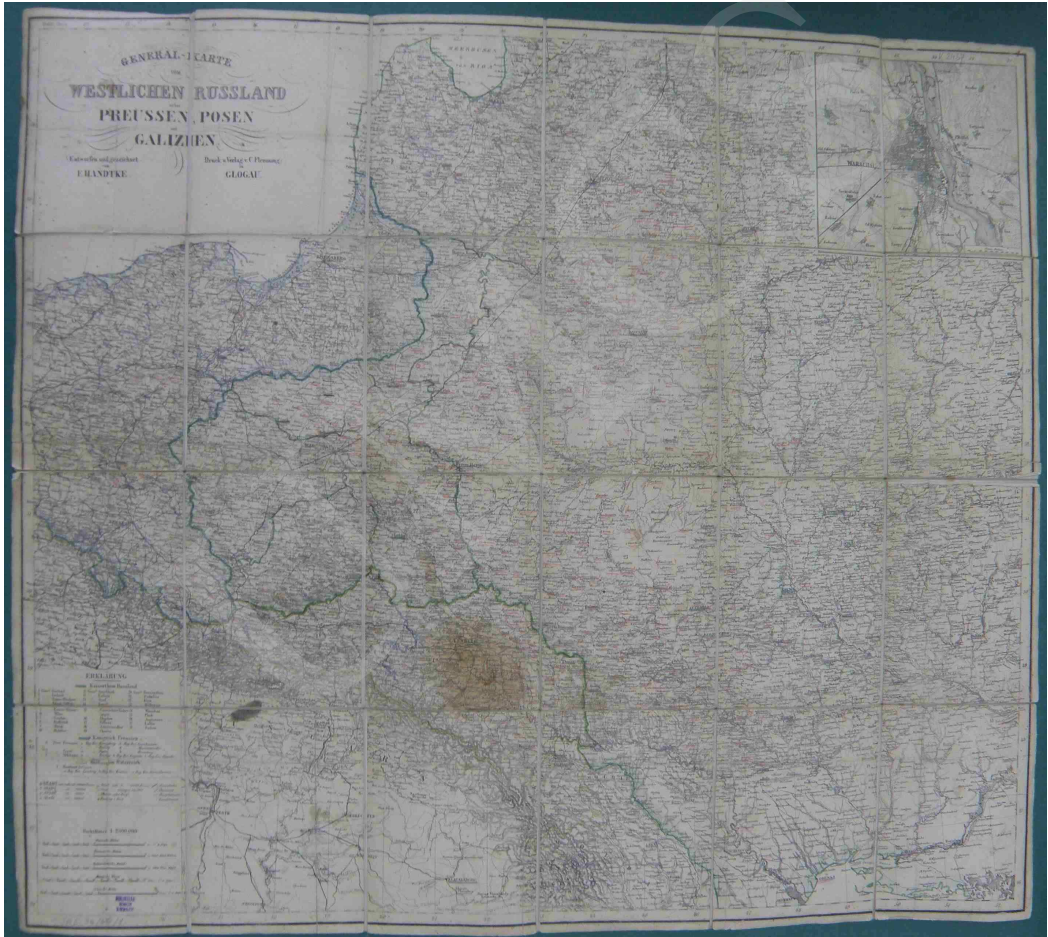
Fot. 14. General-Karte vom Westlichen Russland nebst Preussen, Posen und Galizien entworfen und gezeichnet von F. Handtke

Na mapie (fot. 14) rzeźba terenu została przedstawiona za pomocą metody kreskowej, granice zaś oznaczono kolorami. W lewym dolnym rogu umieszczono legendę oraz skalę liczbową i 5 podziałek liniowych. Dodatkowo, w prawym górnym rogu, widnieje mapa okolic Warszawy w skali ok. 1: 90 000. Mapa jest podklejona na płótnie i umieszczona w ramce.