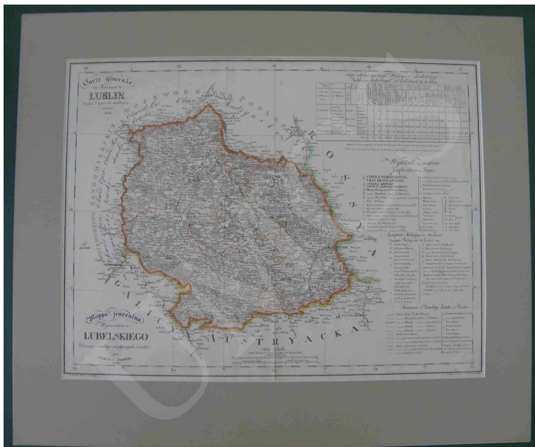
Fot. 12. Mapa jeneralna województwa lubelskiego ułożona według najlepszych źródeł przez Juliusza Colberga

Natomiast mapa województwa lubelskiego (fot. 12) została wykonana techniką litografii ręcznie kolorowanej, z zaznaczonymi granicami politycznymi i administracyjnymi. Na rysunek sytuacyjny mapy składają się elementy matematyczne, fizyczno-geograficzne, społeczno-gospodarcze oraz polityczno-administracyjne. Treść mapy uzupełniają umieszczone na arkuszu tabele statystyczne.