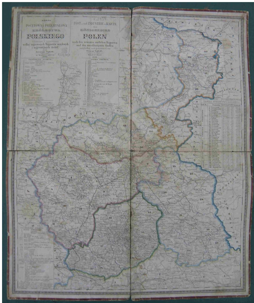
Fot. 11. Karta pocztowa i przemysłowa Królestwa Polskiego. Ułożona i rysowana według najnowszych raportów urzędowych i najpewniejszych źródeł przez Jerzego Engloffa