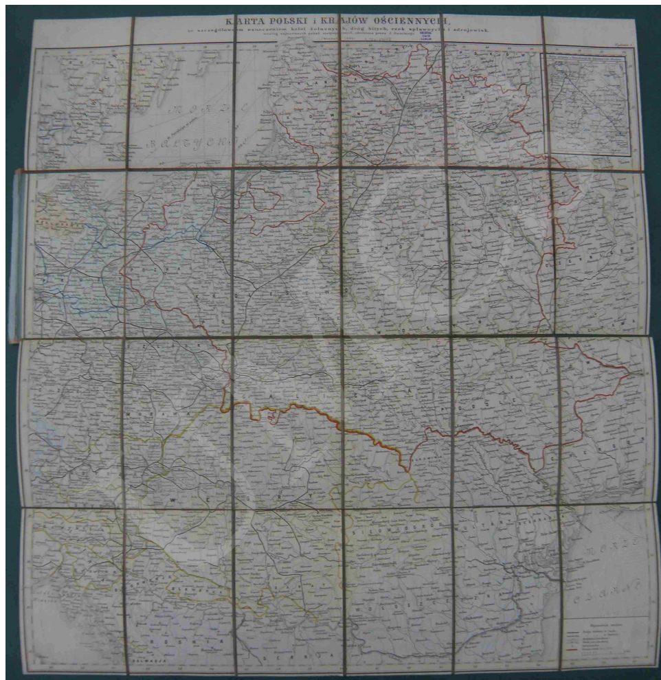
Fot. 5. Karta Polski i krajów ościennych, ze szczegółowym oznaczeniem kolei żelaznych, dróg bitych, rzek splawnych i zdrojowisk, według najnowszych podań statystycznych, skreślona przez J. Osieckiego

delikatnej szrafury (rodzaj cieniowania graficznego). Miasta sklasyfikowano według funkcji administracyjnej, trakty pocztowe podzielono na trakty główne, wśród których wyróżniono drogi bite i zwyczajne. Wszystkie te elementy przedstawiono różnymi rodzajami linii podwójnej. J. Engloff zamieścił na mapie też drogi bite projektowane i w budowie oraz inne drogi zwyczajne o mniejszym znaczeniu. Linie kolejowe wyrysowano za pomocą pogrubianej linii ciągłej z poprzecznymi kreskami i uzupełniono oznaczeniem stacji kolejowych z rozróżnieniem trzech klas