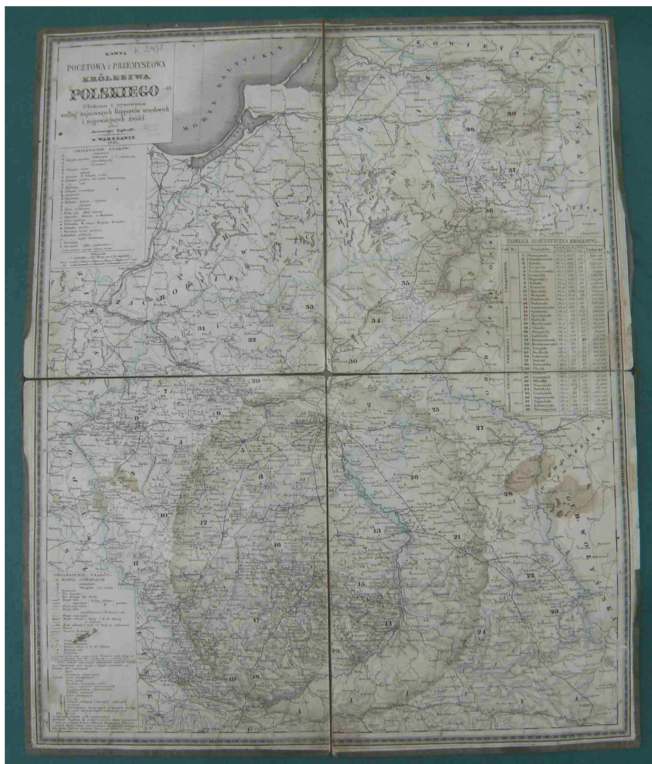
Fot. 7. Karta pocztowa i przemysłowa Królestwa Polskiego, ułożona i rysowana według najnowszych raportów urzędowych i najpewniejszych źródeł przez Jerzego Engloffa

ważności. Elementy komunikacji wodnej zostały oznaczone sygnaturą obrazkową kanałów i rzek spławnych, natomiast urzędy i stacje pocztowe – sygnaturą symboliczną – trąbką pocztyliona. Komory celne podzielono na 3 klasy. Odległości przy traktach pocztowych w granicach Królestwa Polskiego podano w wiorstach, a poza jego granicami w milach, głównie przy ważniejszych traktach pocztowych.